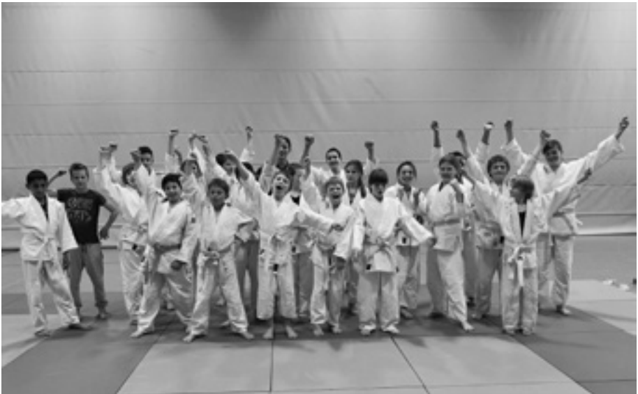
Die zweite Gruppe freut sich, nun endlich alle Techniken üben zu können.

Die Judokas danken den gesamten Vorstand des TV Nierstein für diese erfolgreiche Unterstützung! Wer die glücklichen Judokas oder gar den »weichen Boden« erleben möchte, der ist herzlich zum Freitag-Training eingeladen.