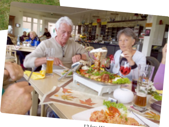
12 km Wandern macht Hunger