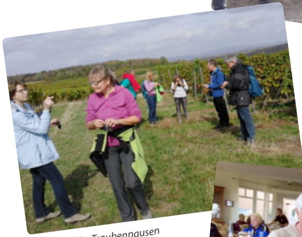
Immer wieder Traubenpausen