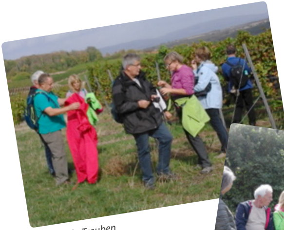
Lecker süße Trauben